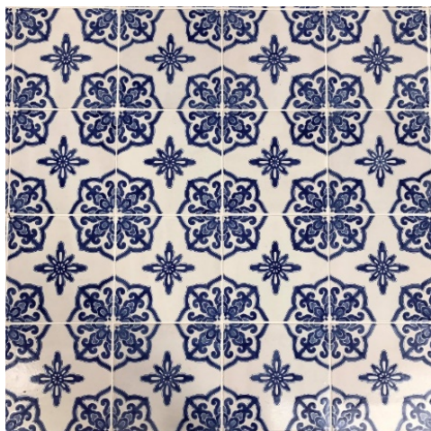
ภาพที่ 4 กระเบื้องปูพื้นบริเวณศาลาแก่ง

เนื่องด้วยอาคารโบราณสถานนั้นเป็นอาคารที่มีอายุและมีคุณค่า ทำให้การอนุรักษ์นั้นมีข้อจำกัดสำคัญในเรื่องของวัสดุ เนื่องจากต้องคงคุณค่าความดั้งเดิม ทำให้การจัดหาวัสดุบางชนิดที่ผลิตขึ้นในอดีต หรืออาจเป็นวัสดุนำเข้าจากต่างประเทศในยุคนั้น ซึ่งไม่สามารถจัดหาได้ในปัจจุบัน จึงส่งผลทำให้เกิดการเปลี่ยนแปลงวัสดุขึ้น