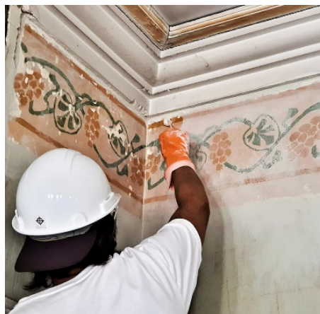
ภาพที่ 9 ช่างทำการลอกชั้นสีทับหน้าเดิมออกจนพบ หลักฐานดั้งเดิมที่ซ่อนอยู่ภายใน