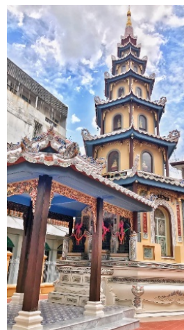
ภาพที่ 5 เจดีย์และศาลาแก่ง วัดกุศลฯ

ดังตัวอย่างกระเบื้องปูพื้นของดั้งเดิมบริเวณศาลาแก่ง วัดกุศลสมาคร ของดั้งเดิมนั้นเป็นกระเบื้องเคลือบขาว-ฟ้า ที่ถูกนำเข้าจากจีน ในสมัยรัชกาลที่ 5 ซึ่งไม่สามารถหาได้ในปัจจุบัน จึงต้องสั่งผลิตพิเศษขึ้นใหม่ทั้งหมด (ภาพที่4) ให้มีลักษณะคล้ายของดั้งเดิมมากที่สุด