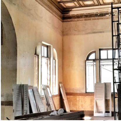
ภาพที่ 10 บริเวณที่พบภาพเขียนสีดั้งเดิม