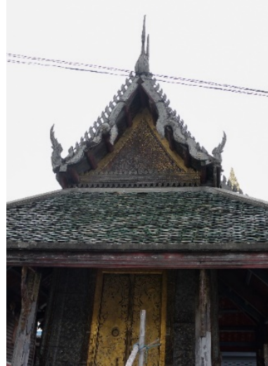
ภาพที่ 2 ภาพถ่ายเก่าของหอพระไตรปิฎก ภาพที่ 3 ภาพถ่ายก่อนบูรณะ ของหอพระไตรปิฎก วัดอัปสรสวรรค์วรวิหาร กรุงเทพฯ