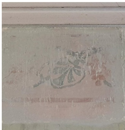
ภาพที่ 8 ผนังที่ถูกทาสีทับลาย Stencil ก่อนบูรณะ อาคารเรือนเจ้าจอมมารดาเลื่อน