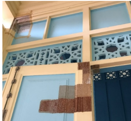
ภาพที่ 7 การขูดลอกเพื่อหาชั้นสีดั้งเดิม

รายงานการบูรณะ โครงการบูรณะเจดีย์และศาลาเก๋ง วัดกุศลสมาคร.