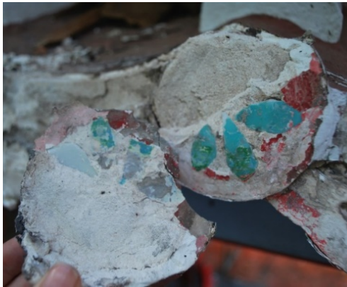
ภาพที่ 6 พบหลักฐานเก่าภายในปูนปั้นปลายกระเบื้อง

การอนุรักษ์อาคารโบราณสถานในเรื่องงานสี โดยทั่วไปช่างสีจะทำการขูดลอกสีเพื่อหาชั้นสีดั้งเดิม (ภาพที่ 7) ดังตัวอย่างของโครงการบูรณะหอเสวยฝ่ายหน้า พระราชनिเวศน์มฤคทายวัน ได้ขูดลอกสีแล้วพบว่าสีดั้งเดิมที่พบแตกต่างจากสีที่ทาปัจจุบัน จากสีครีมเป็นสีเขียวไขก่า ทำให้เกิดงานเปลี่ยนแปลงวัสดุจากหลักฐานเก่าที่พบ