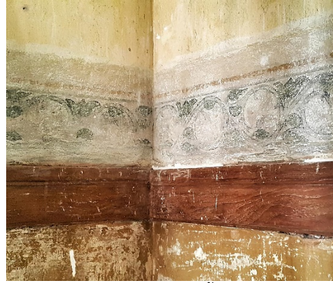
ภาพที่ 11 ภาพหลังจากลอกชั้นสีทับหน้าเดิมออก

บนชั้นสองของบ้านเจ้าพระยาบุรุษรัตนราชพัลลภ