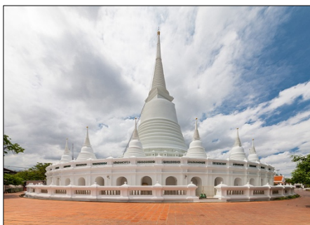
ภาพที่ 5 ภาพพระบรมธาตุมหาเจดีย์ วัดประยุรวงศาวาสวรวิหาร

โครงสร้างภายในพระบรมธาตุมหาเจดีย์ปรากฏเสาก่ออิฐทรงสี่เหลี่ยมขนาดใหญ่ ตั้งจากพื้นสูงขึ้นไปจนถึงยอดพระเจดีย์ มีเสาไม้ตรึงระหว่างเสาก่ออิฐกับผนังพระเจดีย์เป็นระยะจากโคนเสาถึงยอด นับว่าเป็นโครงสร้างขนาดใหญ่ที่ไม่เคยปรากฏมาก่อนในเขตพระนครช่วงสมัยรัตนโกสินทร์