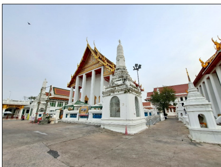
ภาพที่ 2 ภาพพระวิหาร

พระวิหารมีลักษณะเป็นรูปสี่เหลี่ยมผืนผ้า หันหน้าไปทางทิศเหนือ ตั้งอยู่ตรงกลางเป็นประธานของพื้นที่ในเขตพุทธาวาส มีกำแพงแก้วซัดล้อมรอบถึงกัน บริเวณมุมกำแพงแก้วมีการประดับด้วยปราสาทค์ทิศเพื่อเน้นความสำคัญของอาคาร สถาปัตยกรรมของพระวิหารมีลักษณะเป็นทรงคฤห์ หลังคาแบบซ้อน 2 ชั้น 3 ตับ ประกอบด้วยช่อฟ้า ใบระกานาคสะดุ้ง และนาคปั้น มีเฉลียงล้อมรอบ เสาเฉลียงก่ออิฐถือปูน ไม่มีบัวหัวเสาและคันทวยรับชายคา ลายหน้าบรรพ์และหน้าอุดปีกนกผูกเป็นลายดอกบุรณาค ประดับด้วยกระจกลี มีประตูทางเข้าและออกอยู่ทางด้านสกัดด้านหน้าและหลัง ชุ่มประตูเป็นทรงกรอบชุ่มหรือทรงอย่างเทศปั้นปูนลงรักปิดทองเป็นรูปดอกบุรณาค ใบไม้ ดาบ ดริศุล ขวาน ส่วนยอดชุ่มเป็นรูปนกประดับด้วยกระจกลี ชุ่มหน้าต่างมีลักษณะคล้ายกับชุ่มประตู ภายในพระวิหารประดิษฐานพระพุทธรูปหล่อด้วยนาค ปางมารวิชัย พุทธลักษณะศิลปะสุโขทัย พระนามว่าพระพุทธรูปนาค (ภาพที่ 2)