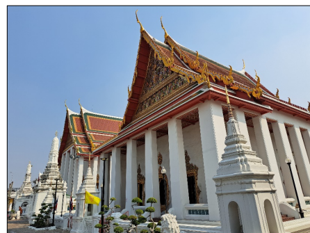
ภาพที่ 3 ภาพพระอุโบสถ