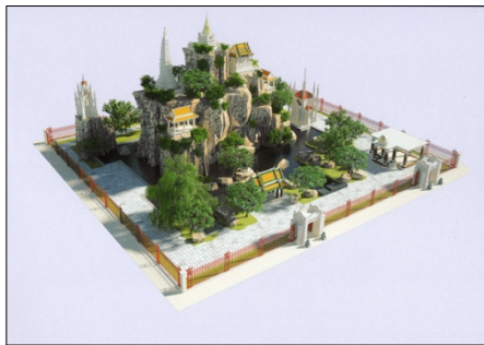
ภาพที่ 7 ภาพทัศนมิติ (Perspective) ภูเขาจำลอง (เขามอ) จากมุมมองทางด้านทิศตะวันตกเฉียงเหนือ

สารริกรธาตุ อัฐิธาตุบุคคลสำคัญหรือพระพุทธรูป ดังนั้นพระเจดีย์จำลองจึงมีลักษณะที่คล้ายกับการประดิษฐานของพระเจดีย์จุฬามณี ที่ตั้งอยู่บนสวรรค์ชั้นดาวดึงส์หรือเป็นธาตุเจดีย์ และพระปราสาทที่สันนิษฐานว่าสร้างขึ้นพร้อมกับการสร้างภูเขาจำลอง (เขามอ) โดยอยู่ทางด้านทิศเหนือของพระเจดีย์จำลอง หากพิจารณากันตามรูปธรรมแล้วนั้น องค์พระปราสาทก็มีศักดิ์ตามคติสัญลักษณ์ทางสถาปัตยกรรม ที่แสดงถึงเจดีย์สถานที่ที่มีรูปแบบเหมือนเขาพระสุเมรุด้วยตัวงานสถาปัตยกรรมอยู่แล้ว แต่เมื่อพิจารณาอย่างองค์รวมทั้งภายในพระปราสาทที่สันนิษฐานว่าบรรจุอัฐิธาตุบุคคลสำคัญในสายสกุลบุณนาค (สำนักงานทรัพย์สินส่วนพระมหากษัตริย์, 2556: 120) และสถานที่ตั้งทางกายภาพที่อยู่ต่ำกว่าองค์พระเจดีย์จำลอง ทำให้ไม่สามารถวิเคราะห์ถึงภาพรวมที่สะท้อนถึงคติจักรวาลทัศน์ในพื้นที่ทั้งพระ-อารามทั้งหมดได้อย่างชัดเจน ทั้งนี้ภูเขาจำลอง (เขามอ) วัดประยุรวงศาวาสวรวิหารนั้นก็อาจจะมิใช่วัตถุประสงค์เป็นเพียงแค่สถานที่บรรจุอัฐิธาตุหรืออุทยานประจำพระอารามเท่านั้น (ภาพที่ 7)