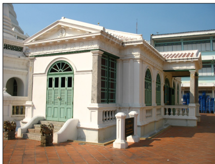
ภาพที่ 6 ภาพพิพิธภัณฑ์พระ ประยุรวงศาการ (พรินทรปริยัติธรรมศาลา)