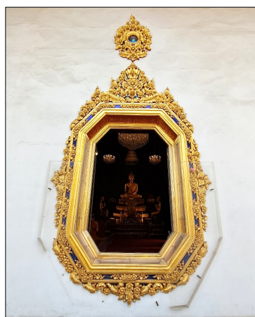
ภาพที่ 4 ภาพหน้าต่างรูปแปดเหลี่ยมทรงผืนผ้า

รูปแบบของชุ้มประตู ชุ้มหน้าต่างและองค์ประกอบต่าง ๆ จึงนับว่าเป็นการผสมผสานกระบวนลวดลาย รูปแบบที่แสดงถึงสัญลักษณ์อันเป็นมงคลต่าง ๆ ภายใต้แบบแผนของการออกแบบอย่างศิลปะตะวันตก ส่วนการสร้างสรรค์ด้วยการปั้นปูนลงรักปิดทองประดับกระจกลีนั้น ก็เพื่อปกป้องปูนปั้นจากสภาพภูมิอากาศได้ดีกว่าแค่การลงรักปิดทองเพียงอย่างเดียว หรือหากแค่เพียงทาสีหรือทาน้ำปูนก็จะทำให้ลายปูนปั้นนั้นกลืนไปกับผนังไม่สามารถสร้างมิติให้เด่นชัดได้ดีเท่าที่ควร