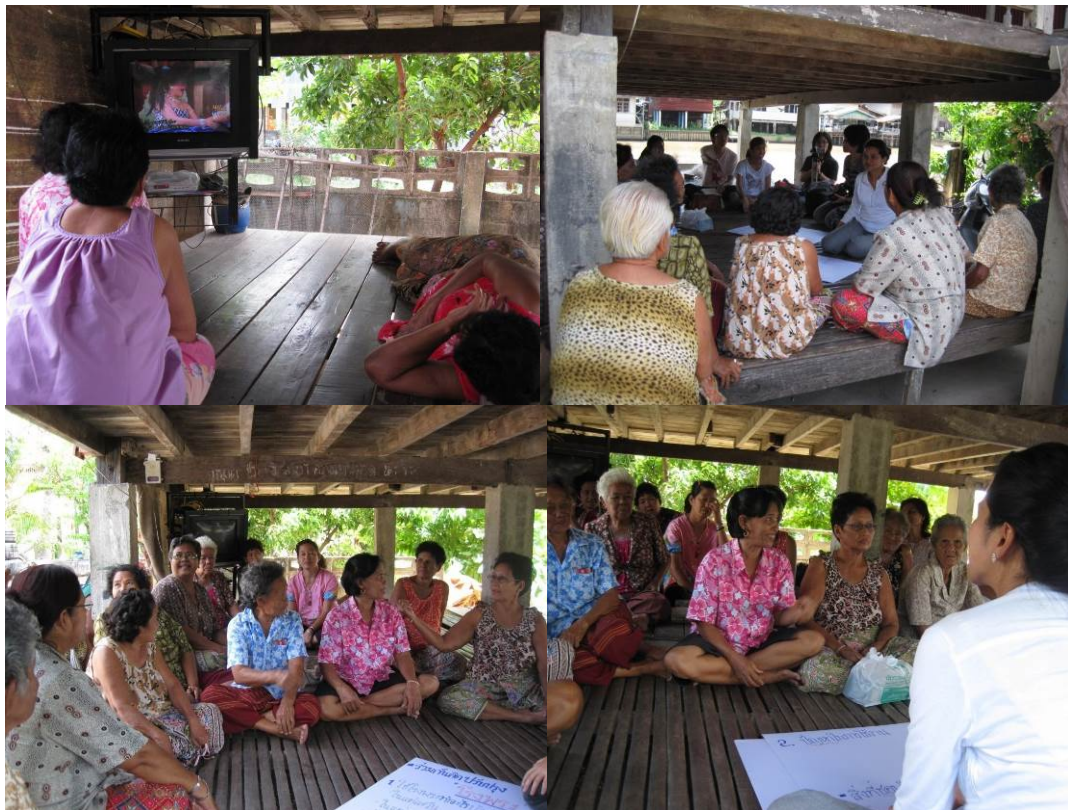
ภาพที่ 7: กิจกรรมร่วมกันแสดงความคิดเห็นเพื่อร่วมกันปรับปรุงโรงพระกับผู้สูงอายุ