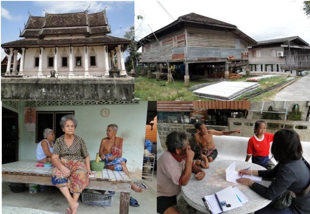
ภาพที่ 3: วัด บ้านเก่า และผู้สูงอายุในย่านลำป่า

ชุมชนย่านลำป่ามีองค์ประกอบทรัพยากรวัฒนธรรมทั้งในเรื่องของสถานที่ ประวัติศาสตร์ อาทิ วังเจ้าเมืองเก่า บ้านเรือนเก่าๆ ในชุมชน และผู้สูงอายุที่มีจำนวนมากในชุมชน แต่ยังคงขาดในเรื่องของการรวบรวมข้อมูล เรื่องเล่า ประวัติศาสตร์ ความสำคัญของพื้นที่ สำหรับด้านกายภาพทั้งในด้านที่อยู่อาศัย สาธารณูปโภค และภูมิทัศน์ในชุมชน พบว่ายังขาดการออกแบบที่เหมาะสมสำหรับคนทุกวัย (Universal design) ทั้งทางลาด การออกแบบทางเดิน สำหรับผู้สูงอายุและผู้พิการในชุมชน โดยหากมองศักยภาพในการพัฒนาเชิงอนุรักษ์ บริเวณย่านลำป่ามีความสำคัญทางประวัติศาสตร์ของเมือง เป็นย่านเมืองเก่า มีทั้งในเรื่องของวังเก่า วัด เรือโบราณ บ้านเก่า ความรู้ ภูมิปัญญาต่างๆ ผู้คนยังคงมีวิถีชีวิตแบบเรียบง่ายมีความใกล้ชิดเป็นกันเอง อย่างไรก็ตาม ปัญหาที่อยู่อาศัย สาธารณูปโภค และภูมิทัศน์ย่านลำป่า ได้แก่ บ้านเก่ามีสภาพทรุดโทรม ระบบสาธารณูปโภคยังขาดการออกแบบที่คำนึงถึงการใช้งานสำหรับคนทุกกลุ่ม อาทิ ทางเดินภายในชุมชน ทางลาดสำหรับรถเข็น เป็นต้น นอกจากนี้ยังขาดบรรยากาศการส่งเสริมการท่องเที่ยว เช่น ป้ายบอกทาง แผนที่ชุมชน แผนที่ทรัพยากรวัฒนธรรม เป็นต้น ดังนั้นหากมองในเรื่ององค์ประกอบและขนาดที่เหมาะสม ชุมชนย่านลำป่าจึงมีประเด็นของการจัดทำแผนการพัฒนาที่อยู่อาศัยระดับพื้นที่ที่เหมาะสมสำหรับดำเนินกิจกรรมนันทนาการ โดยใช้กระบวนการจัดการความรู้ ที่จะนำไปสู่การพัฒนาที่อยู่อาศัยเชิงอนุรักษ์ฟื้นฟูและการปรับภูมิทัศน์ สาธารณูปโภคชุมชน ให้เหมาะสมสำหรับคนทุกเพศทุกวัย ซึ่งมีแนวโน้มที่สามารถดำเนินการให้เห็นเป็นรูปธรรมได้และสามารถเป็นตัวอย่างให้กับชุมชนอื่นๆ ในเขตเทศบาลเมือง