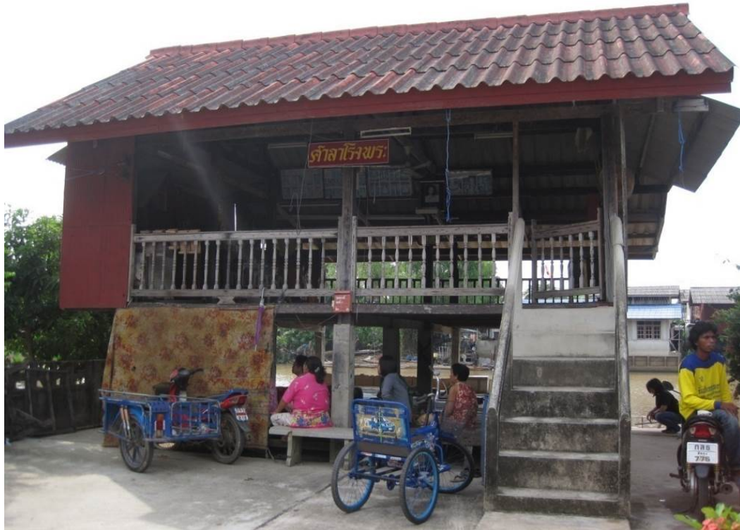
ภาพที่ 6: ลักษณะของโรงพระในปัจจุบัน