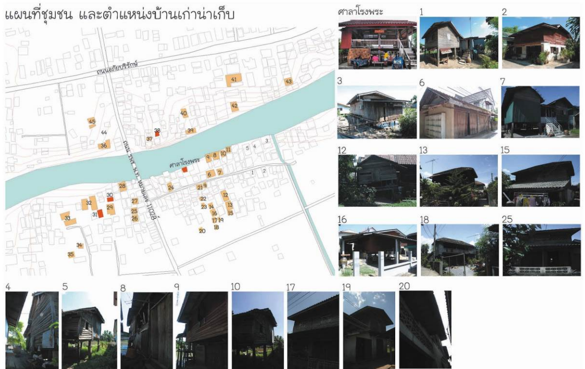
ภาพที่ 5: แผนที่บ้านเก่าในย่านลำป่า