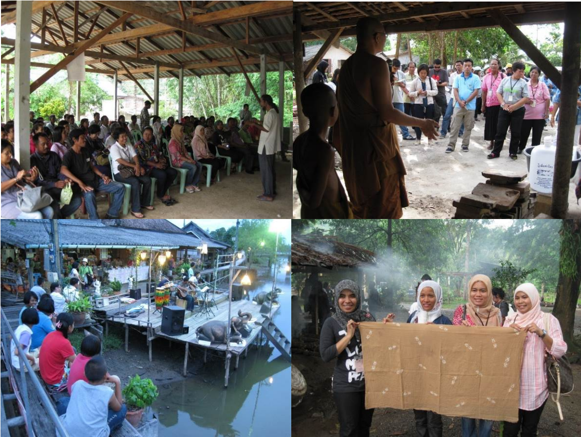
ภาพที่ 13: การศึกษาดูงานในประเทศ

การศึกษาดูงานจากพื้นที่ตัวอย่าง ช่วยให้ผู้ร่วมศึกษาดูงาน ได้เห็นตัวอย่างการจัดการที่เกิดขึ้นเพื่อเป็นแนวทาง สำหรับการประยุกต์ใช้ในชุมชนของตนเอง เป็นส่วนหนึ่งของการสนับสนุนกระบวนการจัดการความรู้ในกระบวนการ แลกเปลี่ยนเรียนรู้ระหว่างชุมชน และในขณะเดียวกันก็เป็นกระบวนการสกัดความรู้ออกจากตนเอง