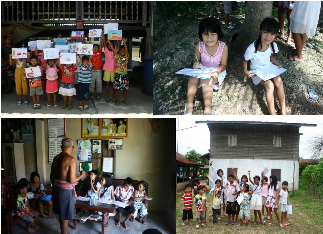
ภาพที่ 4: กิจกรรมร่วมสำรวจแผนที่ทรัพยากรชุมชน

ได้มีการจัดกิจกรรมสำรวจข้อมูลชุมชนร่วมกับเด็กในชุมชนทำน้ำหวานอนและบ้านออก โดยมีเด็กเข้าร่วมกิจกรรมจำนวนกว่า 20 คน ซึ่งเป็นการจัดกิจกรรมแบบไม่เป็นทางการในการสำรวจทรัพยากรในชุมชน ซึ่งเป็นการใช้ศิลปะในการวาดรูปมาเป็นสื่อกลางให้เด็กได้เรียนรู้ชุมชนของตนเอง และเกิดการพูดคุยสอบถามระหว่างเด็กกับคนในชุมชนในเรื่องของประวัติศาสตร์ ภูมิปัญญา สถานที่สำคัญในชุมชน ผู้รู้ในชุมชน ผลจากการดำเนินกิจกรรมในชุมชนทำให้ทราบตำแหน่งทรัพยากรในชุมชนที่เกิดจากการมีส่วนร่วมของเด็กในชุมชน และทำให้เด็กได้เรียนรู้เกี่ยวกับชุมชนตนเอง นอกจากนี้ยังเป็นการสร้างความสัมพันธ์อันดีระหว่างคนในชุมชน โดยที่ผู้ใหญ่เองได้ถ่ายทอดความรู้ประสบการณ์ให้เด็ก ขณะเดียวกันก็ทำให้คณะผู้ศึกษาเห็นศักยภาพของชุมชนมากยิ่งขึ้น ทำให้พบว่าในชุมชนยังมีบ้านเก่าที่ควรอนุรักษ์ มีภูมิปัญญาทั้งในด้านประวัติศาสตร์ การประมง และอาหาร ที่ยังคงหลงเหลือเป็นความรู้ที่อยู่ติดตัวกับผู้สูงอายุและผู้ใหญ่ในชุมชน ซึ่งยังขาดการรวบรวมความรู้เหล่านี้ และขาดการสืบทอดให้กับคนรุ่นหลัง ทีมผู้ศึกษาจึงได้ดำเนินโครงการทำแผนที่บ้านเก่าเพื่อการอนุรักษ์ จัดทำแผนที่แสดงตำแหน่งบ้านเก่าที่อนุรักษ์ไว้ก่อนที่จะเปลี่ยนแปลงไป