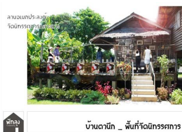
ภาพที่ 9: ลักษณะของบ้านตानीกในปัจจุบัน