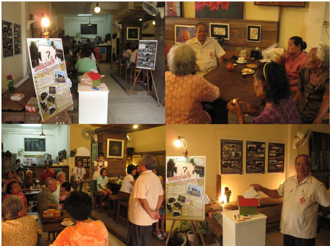
ภาพที่ 14: ภาพวันเปิดนิทรรศการ

ผลลัพธ์จากการศึกษา คือ คณะผู้ศึกษาได้จัดทำแผนพัฒนาที่อยู่อาศัย และแผนป้องกัน/แก้ไขปัญหาชุมชนแออัด (และ/หรือปัญหาที่อยู่อาศัยด้านอื่นๆ) ในชุมชนย่านลำป่า โดยใช้กระบวนการมีส่วนร่วมเพื่อร่างแผนที่เหมาะสมกับความต้องการในพื้นที่ รวมถึงมีวัตถุประสงค์เสริมสร้างศักยภาพด้านการวางแผนป้องกัน/แก้ไขปัญหา และพัฒนาที่อยู่อาศัย ชุมชน และเมืองให้แก่องค์กรปกครองส่วนท้องถิ่นและภาคีที่เกี่ยวข้อง รวมถึงจัดกิจกรรมนำร่องเพื่อการป้องกัน/แก้ไข และพัฒนาที่อยู่อาศัย โดยกิจกรรมทั้งหมดมีจุดประสงค์เป็นส่วนสนับสนุนให้ชุมชนรู้จักสภาพและเข้าใจปัญหาตนเอง อันเป็นผลลัพธ์สำคัญอันหนึ่งของกระบวนการมีส่วนร่วม อันจะเป็นรากฐานสำคัญของการวางแผนพัฒนาที่อยู่อาศัยอย่างยั่งยืนต่อไปในอนาคต