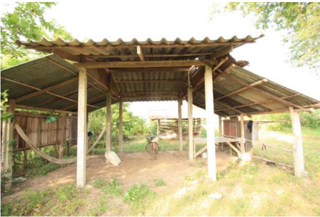
ภาพที่ 5: เกียงนาติดพื้นดิน มีแคร่ที่และผูกเปลยวนในการใช้งาน

4. เกียงนายกพื้นหลายระดับ เป็นเกียงนาที่ใช้ระดับพื้นมากำหนดการใช้งาน พื้นที่สำหรับใช้สอยทั่วไปเป็นที่เปิดโล่ง ส่วนพื้นที่ห้องนอนทำการปิดผนังห้องเฉพาะส่วน แต่ก็พบเหมือนกันที่เกียงประเภทนี้แบบเปิดโล่งทั้งหลังก็มี 25