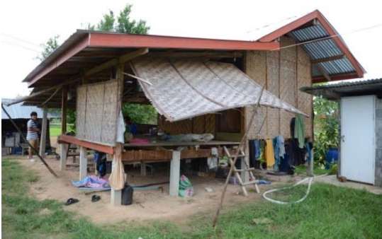
ภาพที่ 7: เกียงนายกพื้น 2 ระดับ ที่มา: ถ่ายเมื่อ 25 กรกฎาคม 2558.