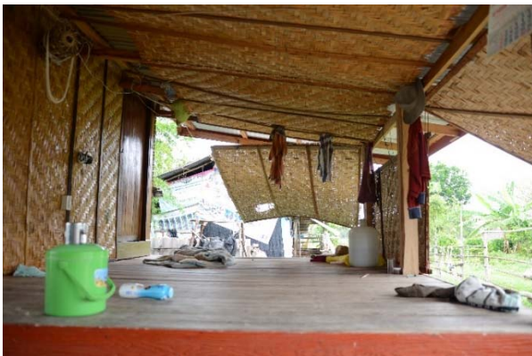
ภาพที่ 12: เถียงนารหัส T1R01 ต.น้ำใส อ.จตุรพักตรพิมาน จังหวัดร้อยเอ็ด

นอกจากนี้ พบว่าเถียงนาเริ่มก่อสร้างจากวัสดุใหม่มากขึ้น กล่าวคือ เดิมวัสดุที่ใช้สร้างเถียงนานิยมใช้ไม้หรือวัสดุที่เหลือจากการสร้างเรือนใหญ่ หรือมาจากการที่เรือนใหญ่ซ่อมแซมเปลี่ยนแปลงวัสดุมาใช้สร้างเถียงนา ดังนั้น วัสดุจึงมีความเสื่อมโทรมบ้างตามอายุการใช้งาน เนื่องจากเถียงนาเป็นเพียงที่พักอาศัยชั่วคราวที่พักเพียงช่วงการทำนาเท่านั้น จึงจำเป็นต้องเน้นเรื่องความสวยงาม หรือใช้วัสดุที่มีราคาสูงในการก่อสร้าง เช่น เถียงนารหัส T1B06 พบที่ตำบลหนองบัวโคก อำเภอลำปลายมาศ จังหวัดบุรีรัมย์ เจ้าของให้สัมภาษณ์ว่าหลังคาสังกะสีเปลี่ยนมาสองรอบแล้ว โดยสังกะสีที่เปลี่ยนเป็นสังกะสีที่รื้อมาจากเรือนใหญ่ที่อยู่ในหมู่บ้าน เป็นต้น ปัจจุบันวัสดุการสร้างเถียงนา เริ่มปรากฏการใช้วัสดุใหม่ที่สั่งมาเพื่อใช้สร้างเถียงนาโดยเฉพาะ เจ้าของเถียงนาเริ่มให้ความสำคัญกับความประณีต ความสวยงาม และความแข็งแรงทนมากขึ้น อย่างเถียงนารหัส T1R01 ที่ตำบลน้ำใส อำเภอจตุรพักตรพิมาน จังหวัด