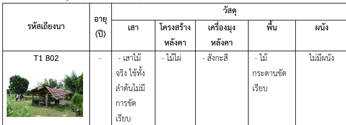
ตารางที่ 1: แสดงข้อมูลวัสดุก่อสร้างเถียงนากลุ่มตัวอย่างจำนวน 12 หลัง

การลงเก็บข้อมูลภาคสนามในครั้งแรก สํารวจเถียงนาที่พบในตำบลหนองบัวโคก อำเภอลำปลายมาศ จังหวัดบุรีรัมย์ ตำบลน้ำใส อำเภोजตุรพัตร์พิมาน และตำบลสูงยาง อำเภอเมืองสรวง จังหวัดร้อยเอ็ด โดยการเก็บข้อมูลด้วยการถ่ายภาพ รั่วัดสถาปัตยกรรม และสัมภาษณ์เจ้าของผู้ใช้งานเถียงนา โดยใช้เกณฑ์การเลือกเถียงนาจากลักษณะทางสถาปัตยกรรมที่เคยมีการจัดกลุ่มเอาไว้ในการศึกษาก่อนหน้านี้ ในการลงภาคสนามในครั้งนี้เก็บตัวอย่างเถียงนาทั้งสิ้น 12 หลัง ซึ่งมีการใช้งานวัสดุก่อสร้าง ดังนี้