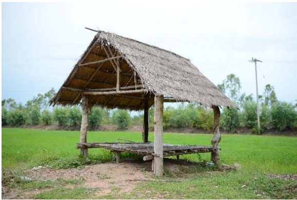
ภาพที่ 3: (ด้านซ้าย) เถียงนาชั่วคราว

สำหรับลักษณะทางสถาปัตยกรรมเถียงนา มีลักษณะและขนาดที่ไม่แน่นอน แต่ปกติมักมีขนาดตั้งแต่ 2 x 2 เมตรขึ้นไป ความคงทนและความประณีตขึ้นอยู่กับที่ตั้งระหว่างเถียงนากับบ้านว่ามีความใกล้หรือไกลมากน้อยเท่าใด มีการระบุการแบ่งประเภทเถียงนาออกเป็น 2 ลักษณะ คือ 1. เถียงนาชั่วคราว เป็นเถียงนาที่สร้างอยู่ใกล้บ้าน เดินทางไป-กลับได้ภายในหนึ่งวัน มีขนาดเล็ก มักใช้เสา 4 ต้นทำเป็นห้องเดียว มีการยกพื้นง่าย หรืออาจไม่ยกพื้น เพราะใช้การนั่งติดพื้นดินได้เลย และ 2. เถียงนาคอนข้างถาวร เป็นเถียงนาที่สร้างไกลจากบ้าน ไม่สะดวกในการเดินทางไป-กลับ โครงสร้างเถียงนามักมีขนาดเสา 6 ต้น สามารถทำห้องได้ 2 ห้อง มีการยกพื้นสามารถอาศัยนอนได้ 21