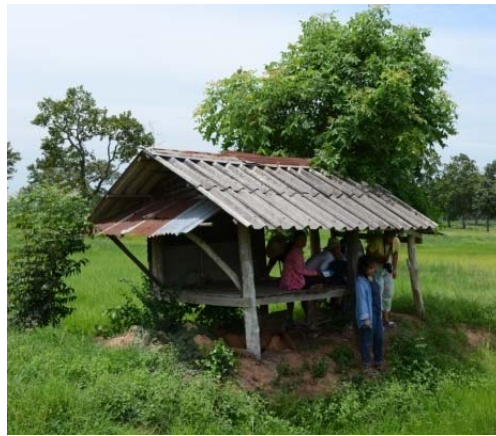
ภาพที่ 6: เกียงนายกพื้นระดับเดียว