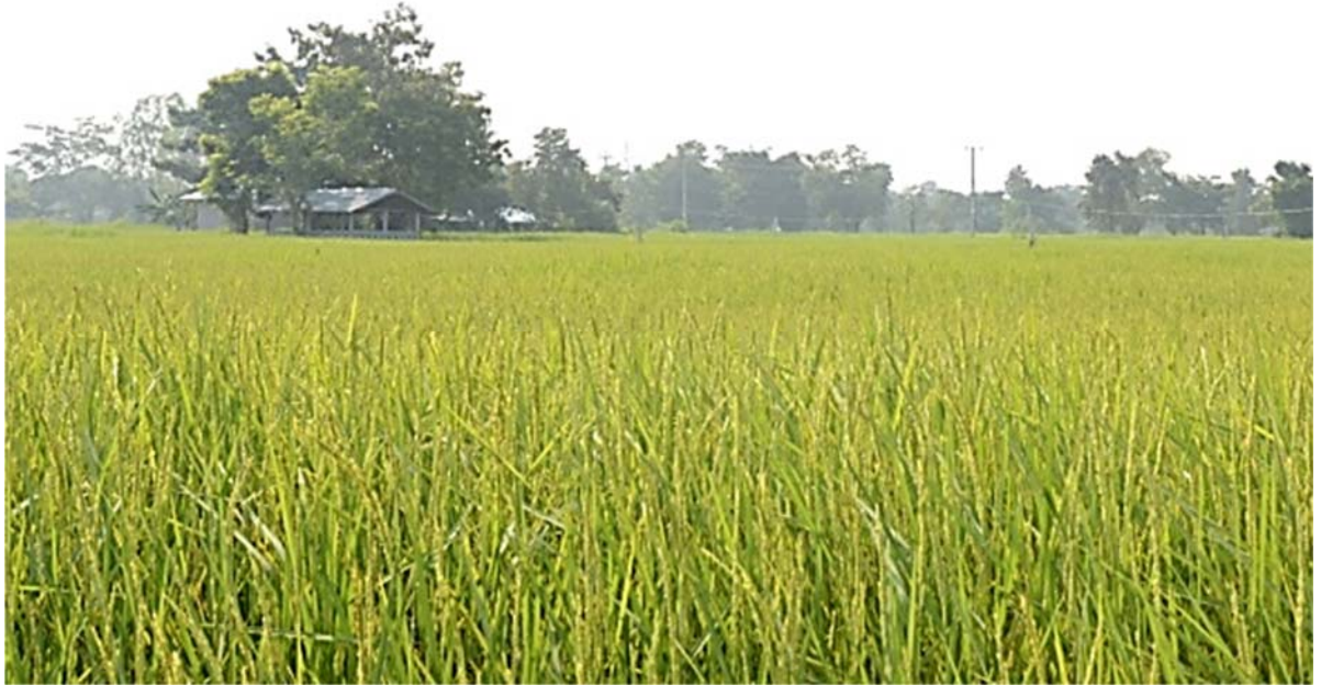
ภาพที่ ๑: เชียงนา สถาปัตยกรรมที่พบในทุ่งนาภาคอีสาน ที่มา: ถ่ายเมื่อ 23 ตุลาคม 2558.