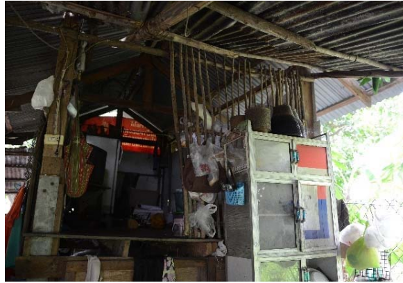
ภาพที่ 10-11: เถียงนารหัส T1R02 ต.น้ำใส อ.จตุรพักตรพิมาน จังหวัดร้อยเอ็ด ที่มา: ถ่ายเมื่อ 25 กรกฎาคม 2558.