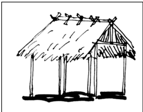
ภาพที่ 9: ลายเส้นเถียงนาเคลื่อนที่

นอกเหนือจากเถียงนาทั้ง 4 รูปแบบแล้ว มีการพบเถียงนาอีกกลุ่มหนึ่งเป็นภูมิปัญญาที่เกิดขึ้นเพื่อแก้ปัญหาของชาวนาที่ไม่สามารถหาพื้นที่ที่เหมาะสมสำหรับการสร้างเถียงนาได้ มีลักษณะเป็นสิ่งปลูกสร้างที่มีเสาหลัก 4 ต้น และโครงสร้างหลังคาไม้ไผ่ใช้หญ้าแห้ง มีน้ำหนักเบา ง่ายต่อการเคลื่อนย้ายได้ เรียกว่ามีลักษณะคล้ายคลึงกับเถียงนาพื้นดินดิน เรียกว่า “เถียงนาเคลื่อนที่” 26