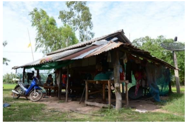
ภาพที่ 4: (ด้านขวา) เถียงนาคอนข้างถาวร พบที่ตำบลสูงยาง ตำบลเมืองสรวง จังหวัดร้อยเอ็ด