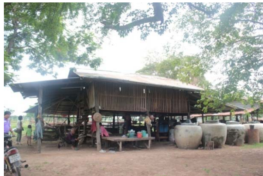
ภาพที่ 8: (ด้านซ้าย) เกียงนายกพื้นหลายระดับ ที่มา: ถ่ายเมื่อ 26 กรกฎาคม 2558.